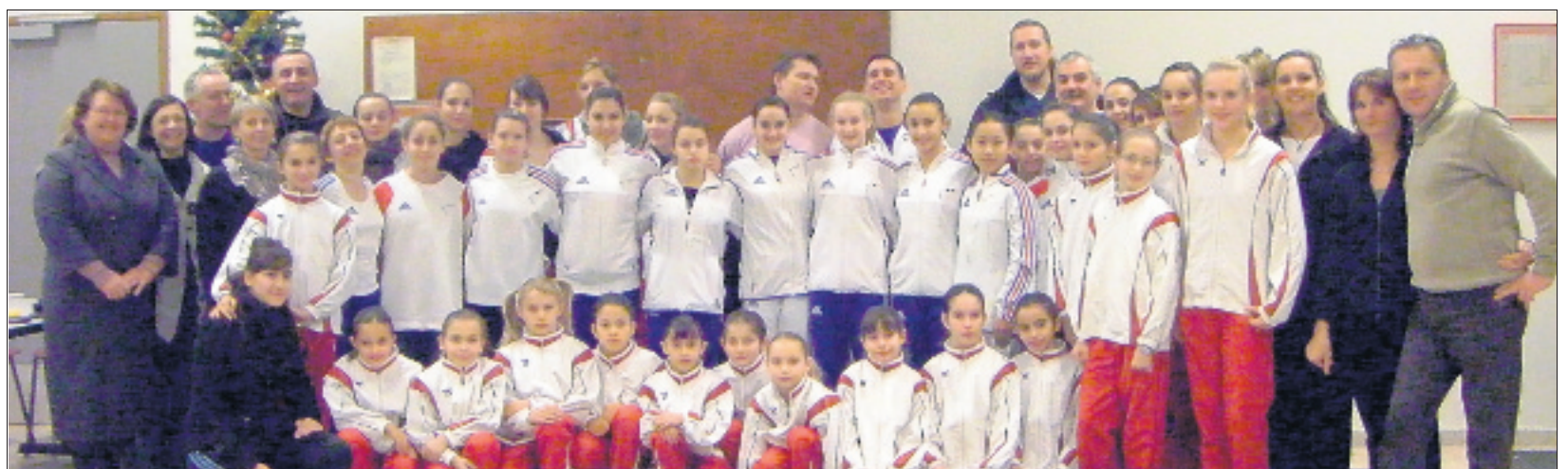
L'équipe de France de gymnastique artistique en bleu et les gymnastes giérois en rouge.

L'équipe de France de gymnastique artistique féminine a, pour la deuxième année consécutive, choisi Gières pour y effectuer un stage d'hiver dans l'optique des Jeux olympiques de Londres en 2012. Durant une semaine du 17